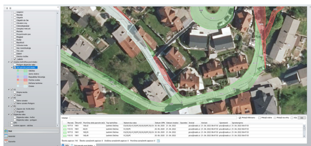
analiza lastništva pod dejansko rabo občinskih cest